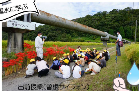
出前授業(管根サイフォン)