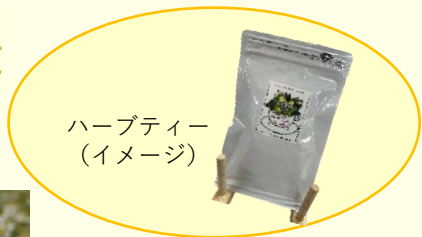
ハーブティー (イメージ)

ポイント②当ツアー限定! ご自身が摘んだカモミールで作ったハーブティーを後日お届け♪